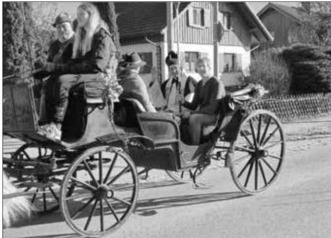
Heuer nach längerer Unterbrechung wieder im Einsatz: der historische Landauer, der beim Gottenauer Leonhardiritt ursprünglich für die „hohe Geistlichkeit“ bestimmt war.