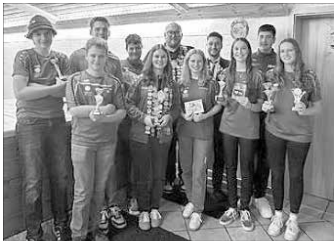
Unsere erfolgreiche Schützenjugend und deren Jungendsportleiter