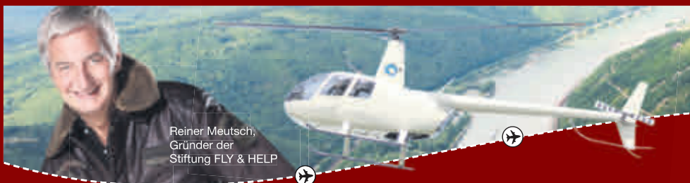
Reiner Meutsch, Gründer der Stiftung FLY & HELP

Plauer Seeblick 43 | 17213 Malchow Tel. 0152 08529030 | urlaub@ferienpark-lenz.de