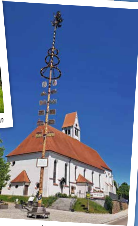
Maibaum Markt Rettenbach