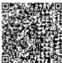
QR-Code: Landratsamt Unterallgäu

Dabei geht es exemplarisch um ein Thema, das Eltern derzeit besonders unter den Nägeln brennt – der Umgang mit Medien im Familienalltag: Wie viel Fernsehen, YouTube oder Netflix ist okay? Was muss mein Kind beim Umgang mit Smartphone und Internet wissen? Wie setze ich Grenzen und Regeln, ohne dass es ständig zum Streit kommt? Wie bleibe ich im Gespräch, wenn Handy und Spielkonsole mehr Aufmerksamkeit bekommen als ich? Die unverbindliche, kostenlose Info-Veranstaltung findet am Mittwoch, 17. Juni, statt, im Kreisjugendamt in Mindelheim, Champagnatplatz 4. Beginn ist um 19 Uhr. Anmelden kann man sich unter www.unterallgaeu.de/eltern oder beim Regionalbüro für Elterntalk, Telefon (08261) 995 8207, E-Mail: eltern-talk@lra.unterallgaeu.de .