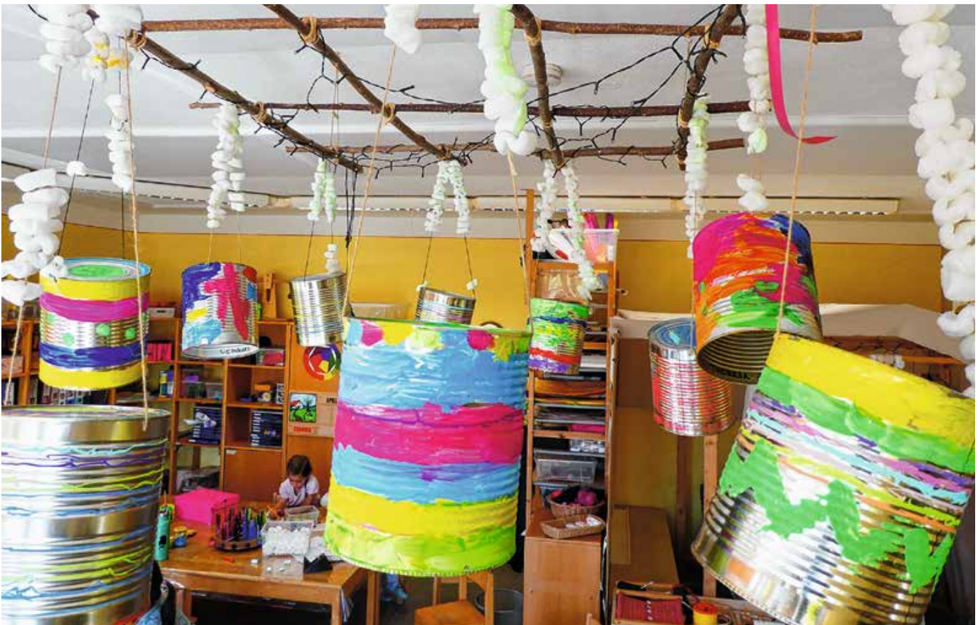
Bild: Kindergarten Engetried