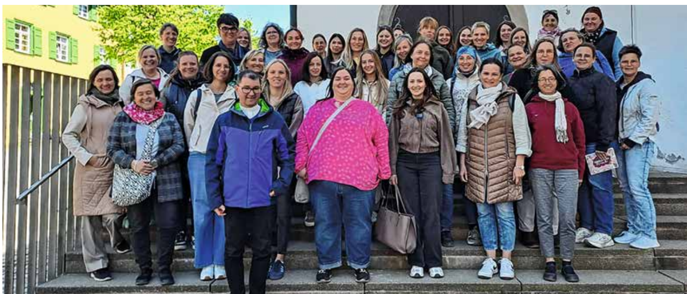
Pädagogisches Team unserer vier Einrichtungen

Nun freuen wir uns auf die Sommerzeit mit vielen Erlebnissen in unserem Garten, bei Projekten, Ausflügen und anderem mehr!