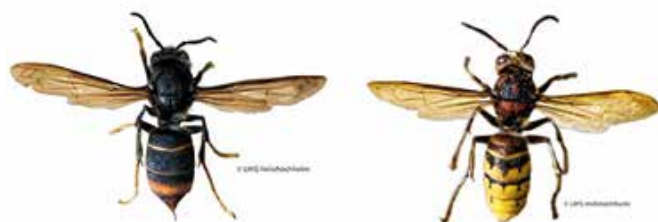
Vergleich zwischen der Asiatischen Hornisse und der Europäischen Hornisse