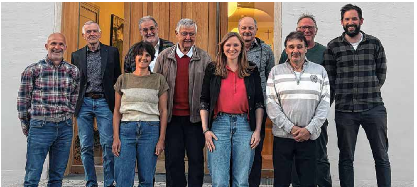
Verabschiedung der ausscheidenden Gemeinderäte

Die Marktgemeinde bedankt sich bei allen ausscheidenden Gemeinderätinnen und Gemeinderäten sehr herzlich für ihren langjährigen Einsatz, ihr großes Engagement und ihren wertvollen Beitrag zur positiven Entwicklung der Gemeinde.