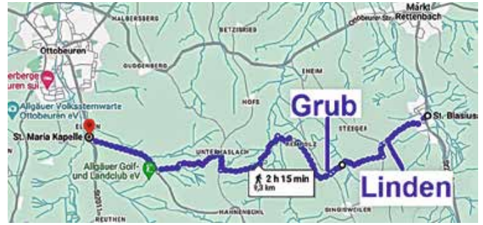
Route der Eldern-Fußwallfahrt.

müssten wir an Stelle der Wallfahrt um 08.30 Uhr einen Pfarrgottesdienst in der Engetrieder Kirche feiern.