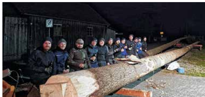
Das beigefügte Bild zeigt die Maibäume aus Erisried (hinten, zwischenzeitlich auf Wanderschaft) und Mussenhausen (vorne, erfolgreich verteidigt) und die beteiligten Mitglieder der FFW Mussenhausen.

Manche Dinge rosten nicht. Dazu gehört offensichtlich auch die Maibaum-Tradition der Feuerwehr Mussenhausen. Nachdem bereits 1999 der Maibaum aus Eutenhausen erfolgreich „umgelagert“ wurde, war es 2026 – quasi in „nächster Generation“ – wieder so weit. Während der eigene Maibaum in Mussenhausen unter strenger Bewachung stand, entstand direkt vor Ort während der Wache die Idee für den nächsten Zug. Aus dem anfänglichen „Aufpassen“ wurde kurzerhand ein „Selber losziehen“. Ein Teil der Mannschaft machte sich noch in derselben Nacht auf den Weg nach Erisried. Ziel klar, Ablauf abgestimmt: hinfahren, holen, heimbringen. Die Aktion verlief letztlich erfolgreich. Ganz so unauffällig und entspannt, wie man es sich wünschen würde, war es zwar nicht, dennoch blieb alles unentdeckt. Erst am Morgen wurde in Erisried festgestellt, dass über Nacht eine spontane „Standortverlagerung“ stattgefunden hatte. Nach den üblichen Verhandlungen – bei denen erfahrungsgemäß weniger juristische Feinheiten als vielmehr flüssige Argumente eine Rolle spielen – konnte man sich schnell einigen: Der Maibaum wurde unversehrt zurückgebracht.