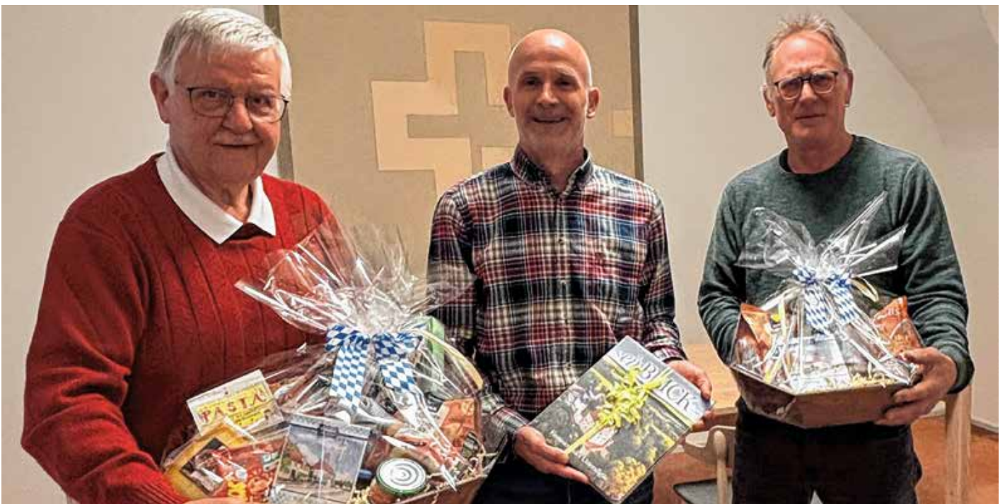
Verabschiedung des 2. und 3. Bürgermeisters