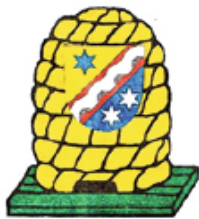
Imkerverein Markt Rettenbach

Die Asiatische Hornisse stellt eine erhebliche Gefahr für die Honigbiene dar. Diese jagt gezielt vor den Bienenstöcken und kann unter ungünstigen Bedingungen bis zu 80 Prozent eines Volkes vernichten. Zusätzlich erschwert ihre Nistweise die Bekämpfung, da sich die Nester in Bäumen in Höhen von über 20 Metern befinden. Umso wichtiger ist die Schulung der Imker. Es wurden die entsprechenden Hinweise zur Erkennung, Meldung und Um-