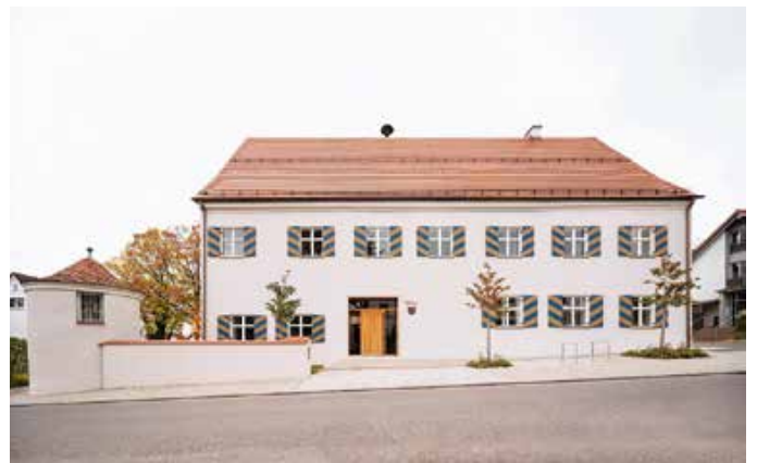
Fuggeramtshaus Markt Rettenbach