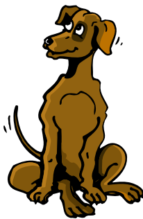
Grafik: Creative Collection

Wir bitten daher alle Hundehalterinnen und Hundehalter, ihre Hunde auf den vorgesehenen Wegen zu führen und private Grundstücke sowie landwirtschaftliche Nutzflächen zu respektieren und bitten um Beachtung.