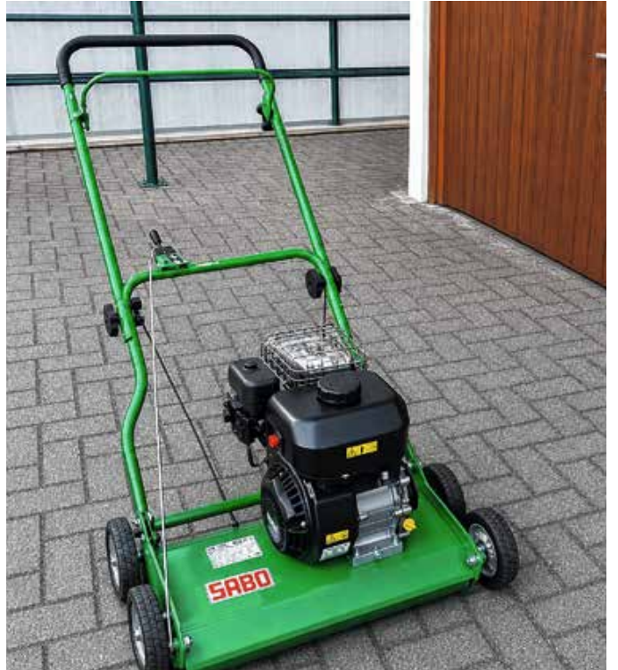
Unsere praktischen Geräte zum Verleih für viele Arbeiten rund um Haus und Garten.