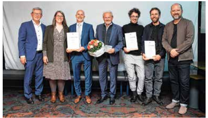
Mit dem Denkmalpreis des Bezirks Schwaben ausgezeichnet: Das Fuggeramtshaus in Markt Rettenbach