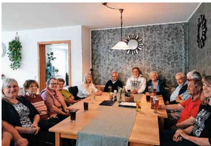
Stammtisch am 16. Juni – der Stammtisch wächst weiter.